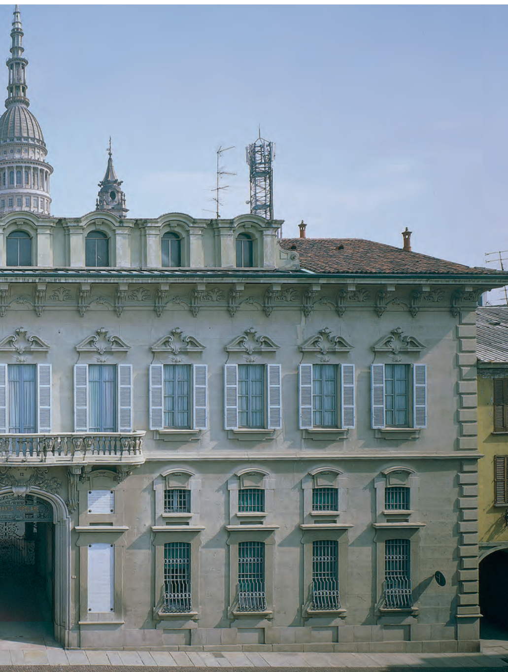
Palazzo Bellini sito in Via Carlo Negroni 12, sede della Fondazione BPN